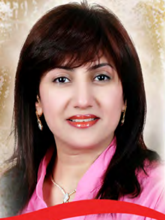
بقلم / لوسى عوض مرجان صحفية و باحثة في التاريخ