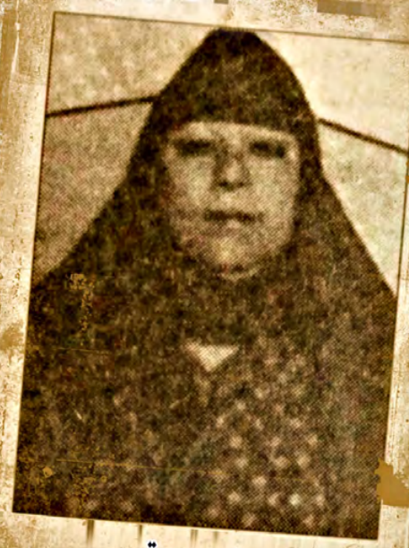
نصيمة فتواية الجمالية