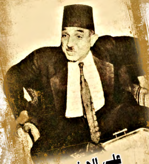
على الحسنى فتوة السيدة زينب