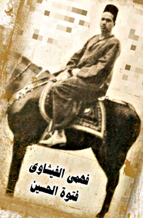
فهمى الفيشاوى فتوة الحسين