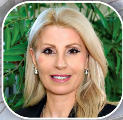
Victoria Abbey Realtor

(مدراء الشركات يمكنهم الحصول على فيزا المدير العام ثم الجرين كارت بعد سنة)