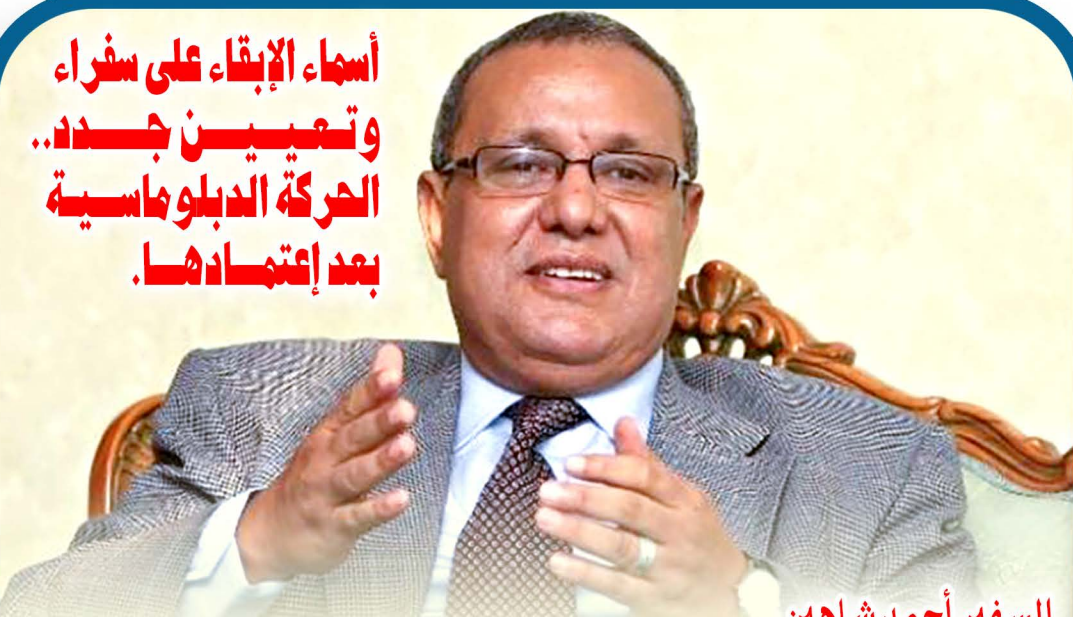
السفير أحمد شاهين