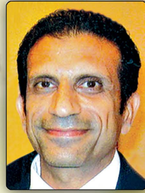
EHAB HANNA INSURANCE AGENCY INC License:# 0172724