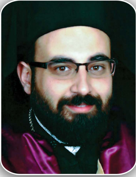
أرشدريت البطريركية المسكونية